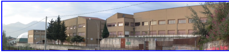
IIS TULLIANO sezione CHIMICA e MATERIALI "N.Parravano" Arpino