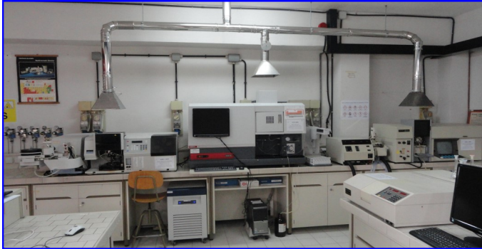
Laboratorio di analisi chimica strumentale