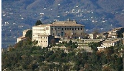
Castello Ladislao –Arpino (FR)